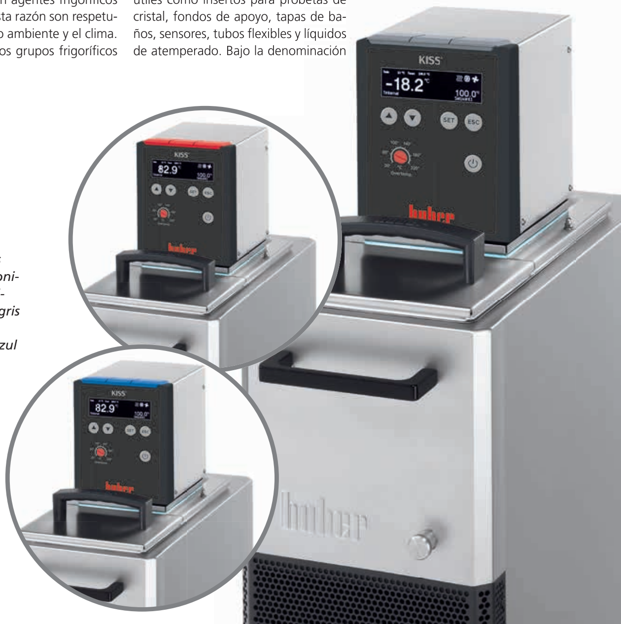
Fig. 5: Los termostatos KISS están disponibles en tres variantes de color: gris (estándar), rojo (Ref. 61998) y azul (Ref. 61999).

"SpyLight" se dispone además de un software sin cargo para control radioeléctrico, registro de datos de medición y visualización.