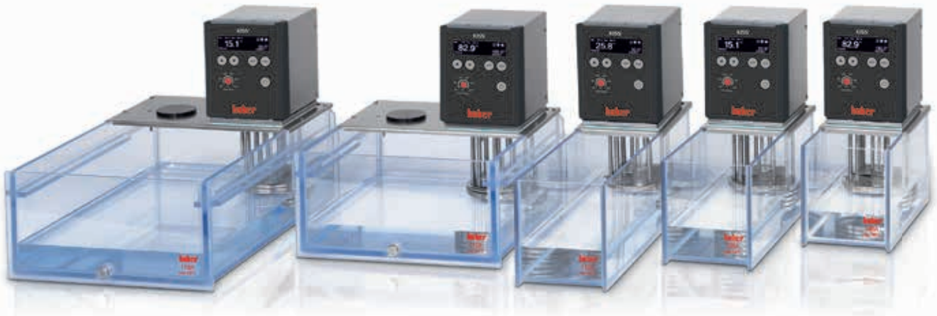
Fig. 4: Los termostatos de baño KISS están disponibles con baños de policarbonato transparente o de acero inoxidable. Las cantidades de llenado alcanzan de 6 a 25 litros.

baños alcanza, según el modelo, de 6 a 25 litros. Para tareas de refrigeración se dispone de termostatos de refrigeración para temperaturas de trabajo de hasta -30\text{ }^{\circ}\text{C} . Estos modelos ya trabajan de serie con agentes frigoríficos naturales y por esta razón son respetuosos con el medio ambiente y el clima. Adicionalmente los grupos frigoríficos